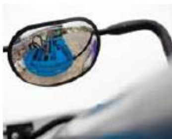
ЗЕРКАЛО ЗАДНЕГО ВИДА ТИПА «РЫБИЙ ГЛАЗ»