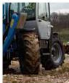
ПРИВОД НА ЧЕТЫРЕ КОЛЕСА РУЛЕВОЕ УПРАВЛЕНИЕ НА ЧЕТЫРЕ КОЛЕСА