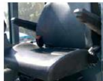
РЕГУЛИРУЕМОЕ СИДЕНЬЕ С ПОДЛОКОТНИКАМИ НА ПОДВЕСКЕ