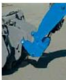
БЫСТРАЯ СЦЕПКА НАВЕСНЫХ ПРИСПОСОБЛЕНИЙ ИЗ КАБИНЫ