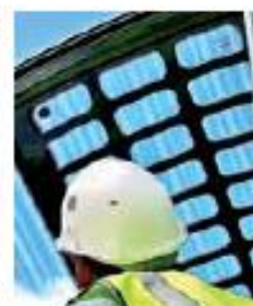
ЗАЩИТНАЯ РЕШЕТКА КРЫШИ