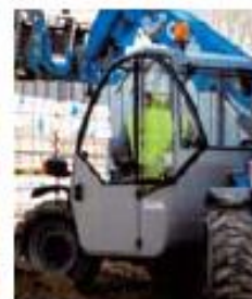
ДВЕРЬ ДВУХСЕКЦИОННАЯ: СТАЛЬ НИЗ, СТЕКЛО ВЕРХ. КАЖДАЯ СЕКЦИЯ ОТКРЫВАЕТСЯ ОТДЕЛЬНО.