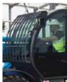
ЗАЩИТНАЯ РЕШЕТКА ВЕТРОВОГО СТЕКЛА